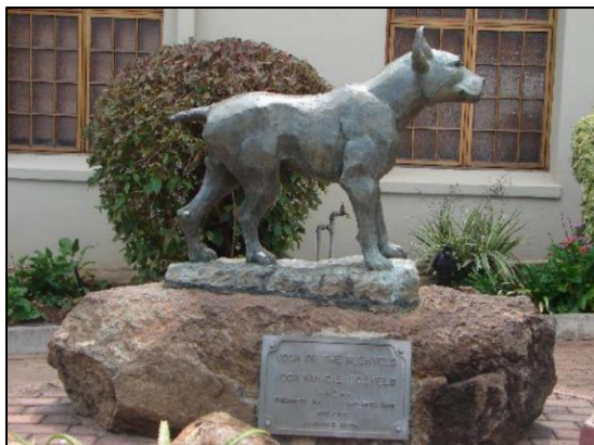
Die 'Jock of the Bushveld' monument in Barberton, Mpumalanga.